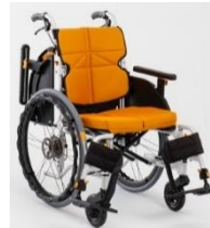
ネクストコア-アジャスト 自走【NEXT-51BHB】 介助【NEXT-61BHB】