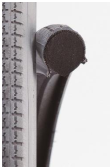
ハイブリッドタイヤ 断面