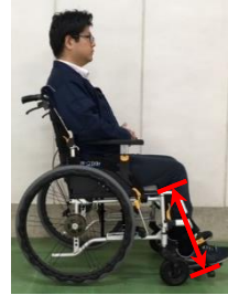
【前座高47cm】 フット長45.5cm 足の長さもピッタリ！