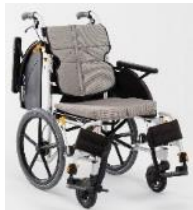
ネクストコア-マルチ 自走【NEXT-31BHB】 介助【NEXT-41BHB】