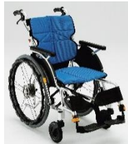
ネクストコア 自走【NEXT-11BHB】 介助【NEXT-21BHB】