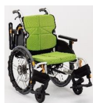
ネクストコア-ミニモ 自走【NEXT-50BHB】 介助【NEXT-60BHB】

ネクストコアシリーズに、空気管理不要のハイブリッドタイヤ(ノーパンク)仕様のモデルが新登場！