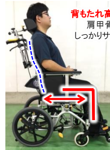
【前座高47cm】 足の長さもピッタリ！